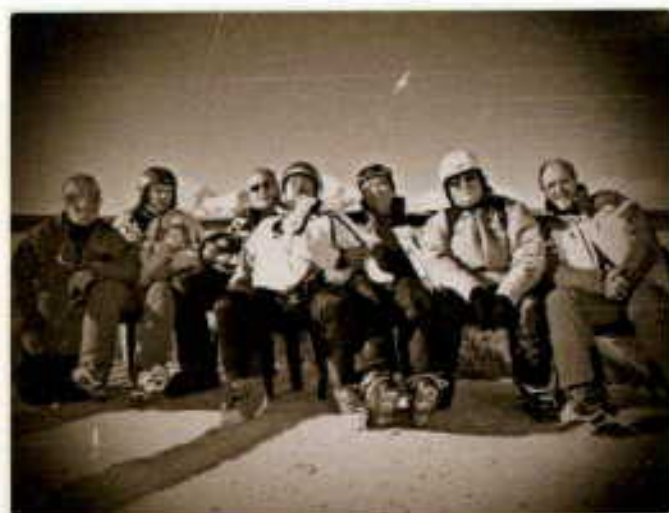
C'erano una volta...