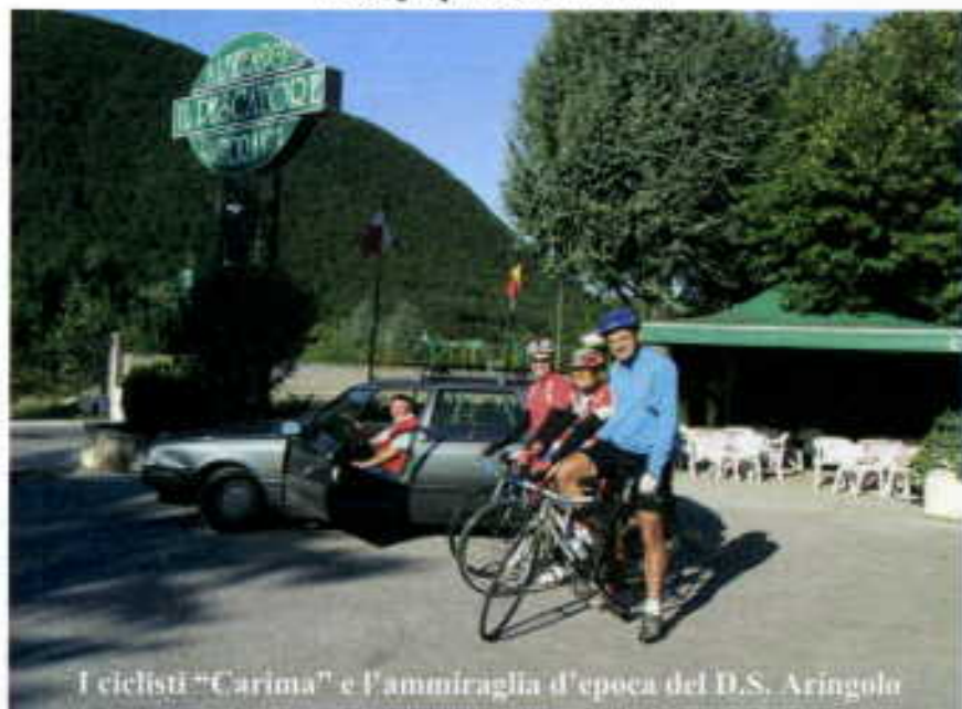
I ciclisti "Carima" e l'ammiraglia d'epoca del D.S. Aringolo

Le ruote per la verità ci hanno sempre girato, a noi della sezione ciclismo della Carima, ma da alcuni anni, troppi, le facevamo girare ognuno per suo conto, magari indossando le divise coi colori della Banca, lungo i meravigliosi percorsi della nostra provincia. Il passato del gruppo di ciclisti è però ricco: partecipazioni in bici alle Feste della Primavera, gite in pullman a Milano per la "Fiera del ciclo", percorsi di un giorno e "settimane ciclistiche" in giro per le regioni: dal Veneto alle Puglie, alla Sardegna... Quest'anno abbiamo finalmente riallacciato i contatti e "riavviato" le ruote e le belle amicizie. Dopo una prima riunione organizzativa con pizza il 18 aprile, il 31 maggio avremmo dovuto pedalare intorno a Fabriano in occasione della Festa della Primavera se non si fossero, proprio quel giorno, aperte le cateratte; risultato: le bici sono rimaste nelle auto, noi ciclisti, e non solo noi, ci siamo rinfrancati gustando il ricco menù della Festa. Ma ve-